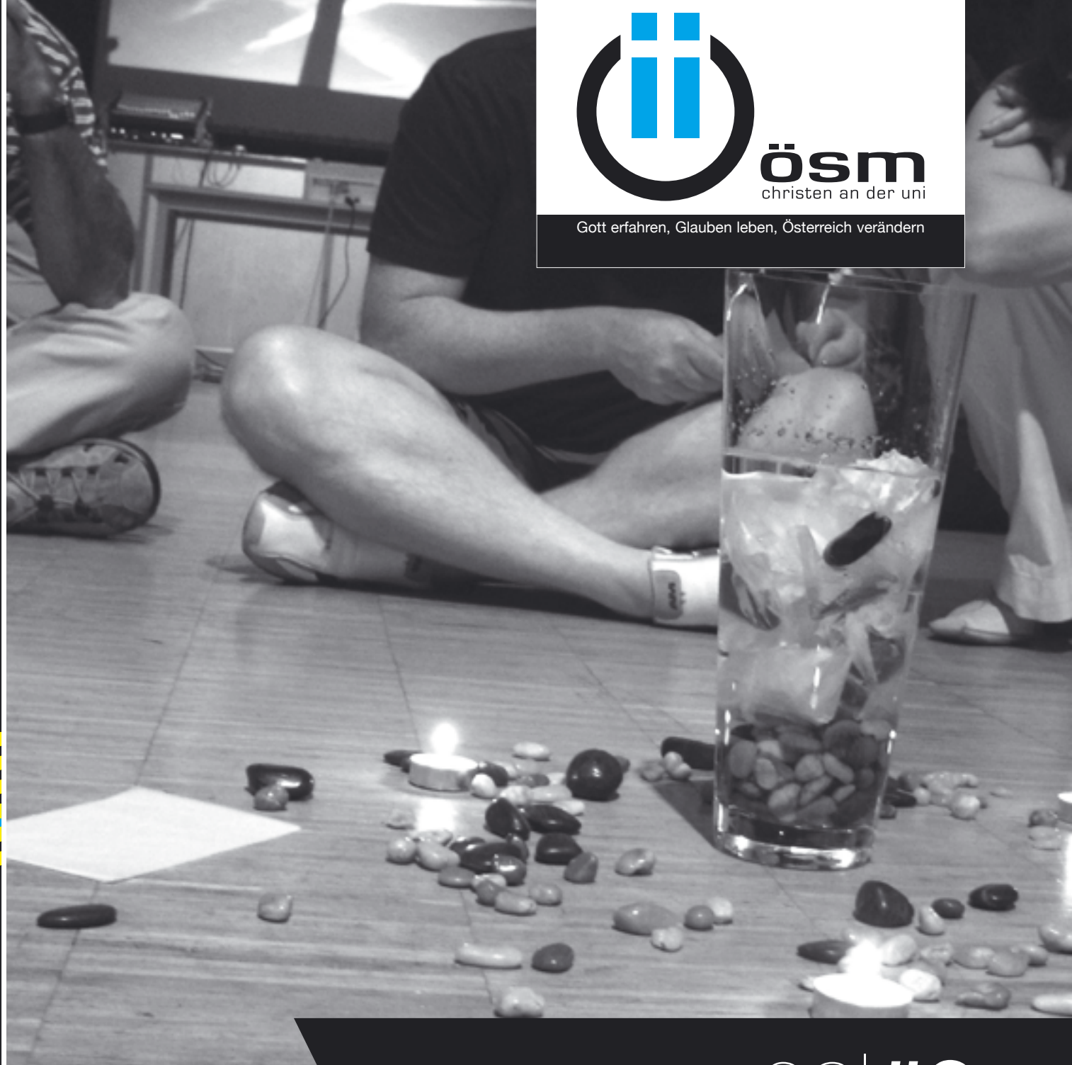
Abschlussabend der Sommertage

Gott erfahren, Glauben leben, Österreich verändern