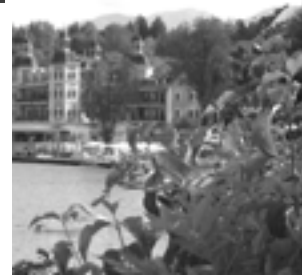
Blick auf Velden