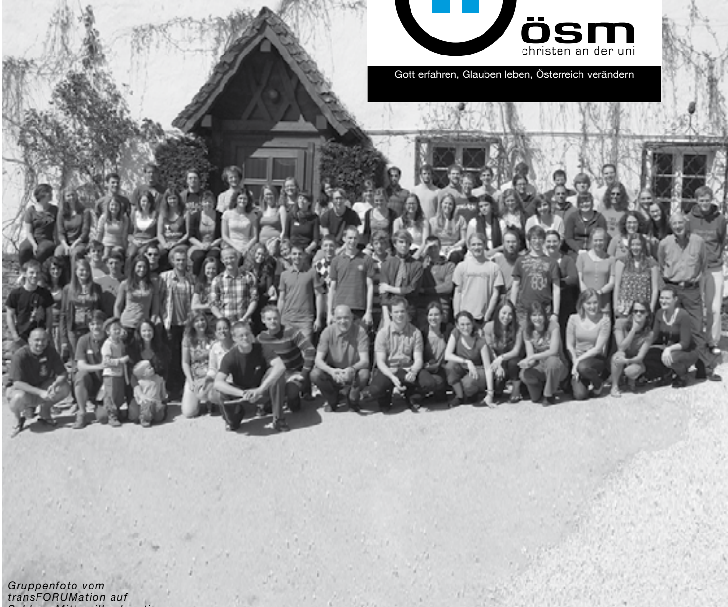
Gruppenfoto vom transFORUMation auf Schloss Mittersill... kreative Studentenkonferenz, welche die Beziehung zum Herrn anhand des Kolossierbriefes vertiefte.

Gott erfahren, Glauben leben, Österreich verändern